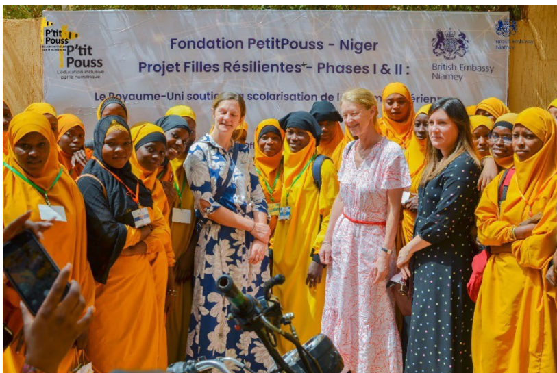
Bezoek van de Engelse ambassadeur (in roze jurk)

Januari 2023 was de officiële lancering van de samenwerking met het Verenigd Koninkrijk. In de officiële versie: Het doel van het project "Filles résilientes+" is "bij te dragen aan de continuïteit van het onderwijs en de professionele integratie van veertig (40) meisjes/vrouwen die vroegtijdig school hebben verlaten en in een precaire situatie verkeren in de wijken Talladjé, Koira tégui, Harobanda en Dan zama". Ook financieel zijn beide samenwerkingen interessant. De Fransen hebben 16.000 euro gedoneerd op voorwaarde van cofinanciering van 7000 euro (niet via SWEF, maar direct aan de lokale stichting). Dit hebben we kunnen bekostigen uit de lopende financieringen. De Engelse ambassade doneerde 20.000 euro voor het opzetten van het vervolgtraject, het zorgen voor beroepsopleidingen. Echter is het beleid van de Engelsen over te gaan tot betaling aan het einde van het project. Dit heeft geleid tot extra financiële input van SWEF aan de Fondation PetitPouss Niger.