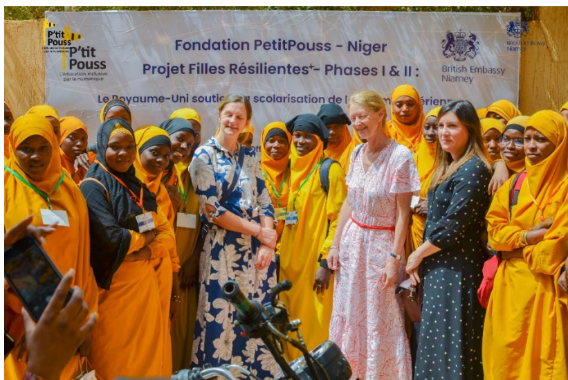
Bezoek van de Engelse ambassadeur (in roze jurk)

Januari 2023 was de officiële lancering van de samenwerking met het Verenigd Koninkrijk. In de officiële versie: Het doel van het project "Filles résilientes+" is "bij te dragen aan de continuïteit van het onderwijs en de professionele integratie van veertig (40) meisjes/vrouwen die vroegtijdig school hebben verlaten en in een precaire situatie verkeren in de wijken Talladjé, Koira tégui, Harobanda en Dan zama". Ook financieel zijn beide samenwerkingen interessant. De Fransen hebben 16.000 euro gedoneerd op voorwaarde van cofinanciering van 7000 euro (niet via SWEF, maar direct aan de lokale stichting). Dit hebben we kunnen bekostigen uit de lopende financieringen. De Engelse ambassade doneerde 20.000 euro voor het opzetten van het vervolgtraject, het zorgen voor beroepsopleidingen. Echter is het beleid van de Engelsen over te gaan tot betaling aan het einde van het project. Dit heeft geleid tot extra financiële input van SWEF aan de Fondation PetitPouss Niger.