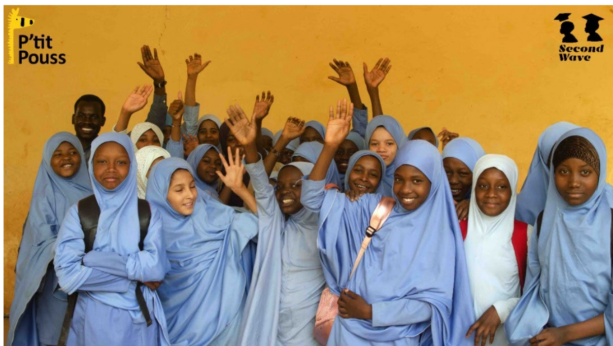
Een van de klassen in Niamey met kinderen die werken met PetitPouss

2023 Was een bewogen jaar. Niet alleen op het wereldtoneel waar de oorlog in Oekraïne voortduurt, en in Israël en Gaza zich drama's afspelen. Ook Niger bleef niet gespaard met een staatsgreep in juli die alle ontwikkelingen die het land in positieve zin doormaakte, tien jaar achteruit plaatste. Met directe gevolgen voor ons als stichting Second Wave Education Foundation (SWEF). Veel fondsen verlegden hun focus en op gebied van investeringen kon het land het wel vergeten. Ook konden we niet meer reizen – tot halverwege 2024. Desalniettemin is het grote succes van onze stichting in Niger dat de samenwerking met UNICEF officieel is, en dat het Verenigd Koninkrijk een duurzame relatie wil. In Tsjaad is de stichting Fondation PetitPouss Tchad opgericht en werd de aanvraag voor autorisatie in oktober gedeponereerd De autorisatie zelf kwam begin 2024 binnen. In Togo is in 2023 niets gebeurd, wel hebben we het kantoor open gehouden Financieel gezien heeft de stichting een matig resultaat geboekt, maar wel de weg geplaveid voor een positief 2024.